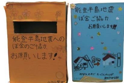
子どもたちの手作りの義援金箱