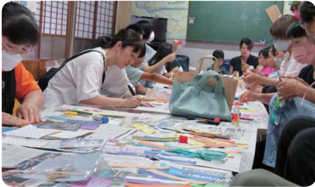
セタづくりで世代間交流