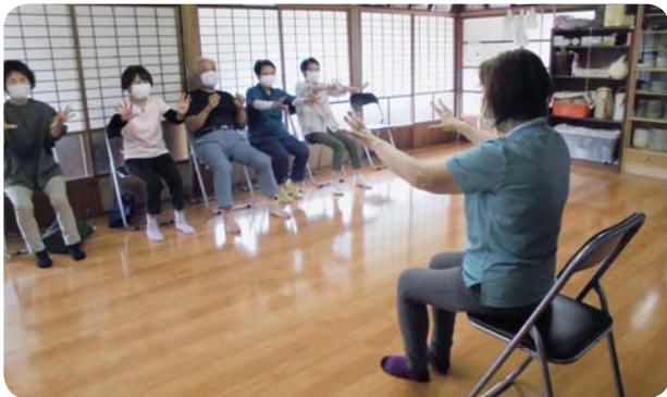
地区公民館でのサロン