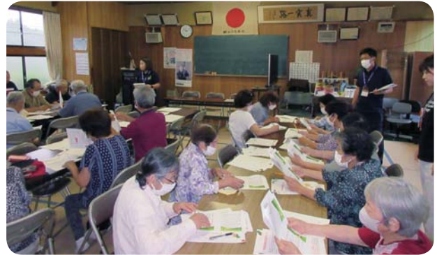
コーディネーターによる住民説明会