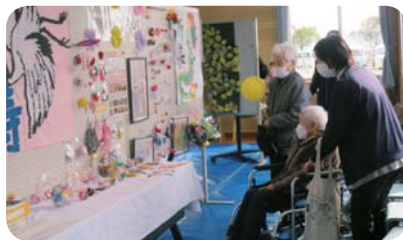
通所系事業所研修会 「福祉まつり作品展」