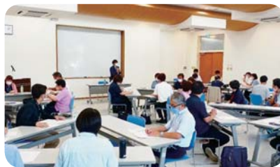
ケアマネジャー向け研修会 「成年後見制度について」