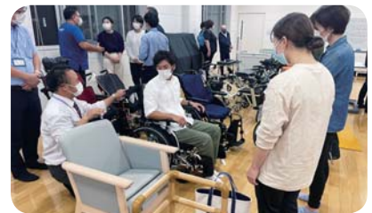
訪問系事業所研修会 「福祉用具体験会・移乗介助実演」