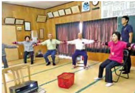
小川町耕地地区福祉会

参加者は「自分のために頑張っている」「体操すると気持ちよか」などの声が聞かれています。