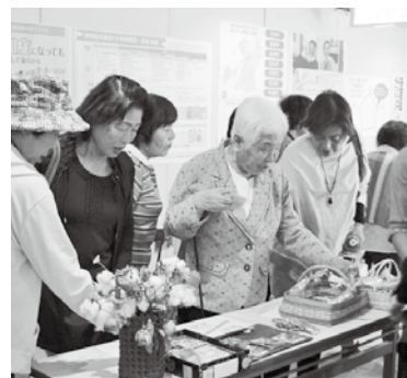
認知症啓発パネルコーナー