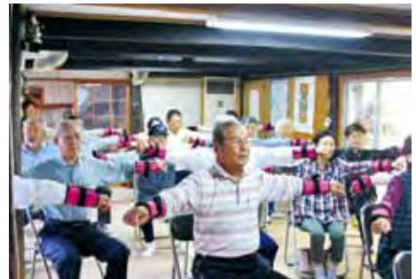
三角町田井浦地区福祉会