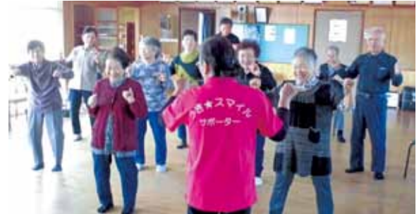
認知症予防 指体操

参加者は「認知症にならんごつがんばらなん、みんなと一緒に話ができて楽しか」と笑顔で話していました。